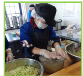
クオリティオブライフ