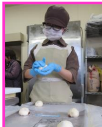
ぱく to Pan