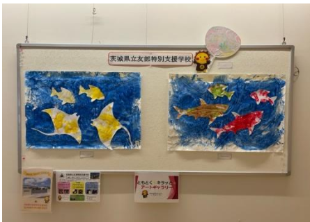
地域交流センターともべ 「Tomoa」