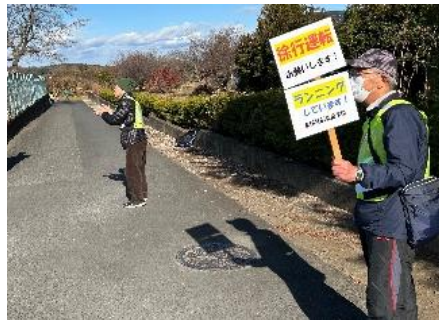
行事支援（耐久走大会）