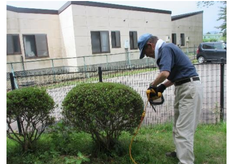
環境整備（植木の剪定等）