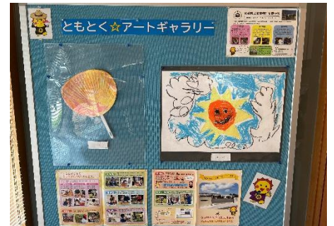
地域交流センターいわま 「あたご」