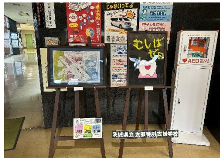
茨城町総合福祉センター 「ゆうゆう館」