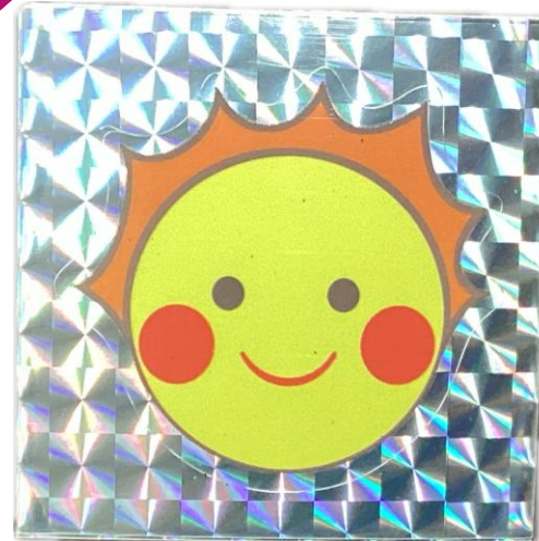
ともよっち ステッカー