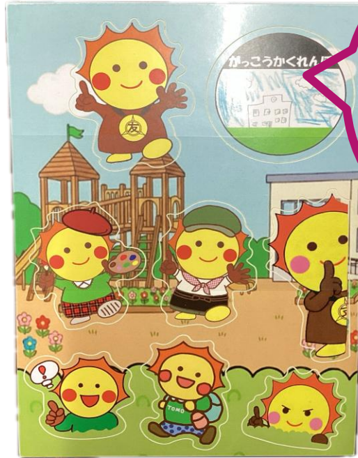
「学校かくれんぼ」 限定シール