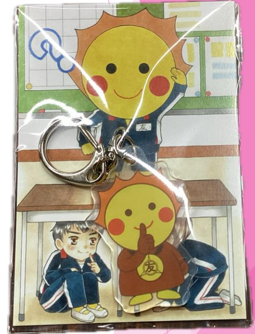
ともよっち キーホルダー