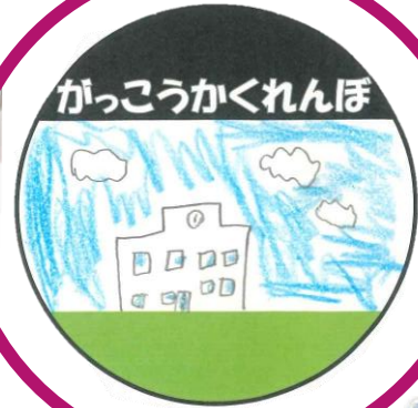
小学部5年生 デザインのロゴ